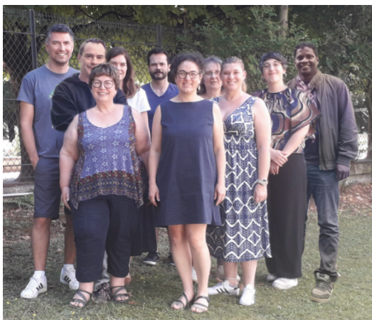
Le nouveau bureau 2025-2026

ISSN 0296 - 533X (imprimé) - ISSN 2606-0345 (en ligne)